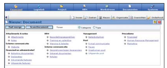
Al uw documenten onderverdeeld in duidelijke categorieën.